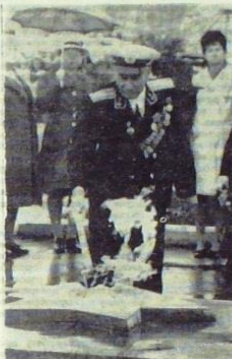
Вечная слава героям Великой Отечественной.