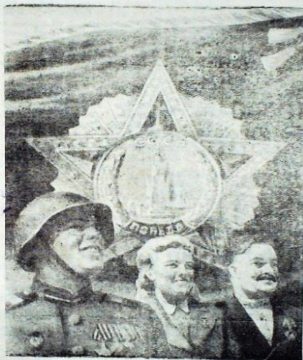
Рис. Н. Павлова.

Успехи Советского Союза, рост сил лагеря демократии и социализма не дают покоя поджигателям новой войны. Мировая реакция во главе с Соединёнными Штатами Америки пытается политической шайкой за-