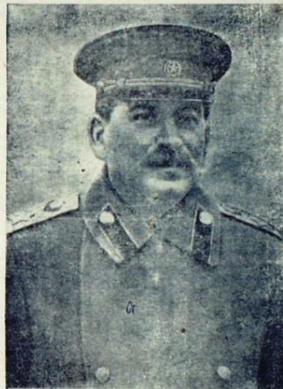
Верховный Главнокомандующий Маршал Советского Союза Иосиф Виссарионович СТАЛИН (октябрь 1944 г.).

Подписано 8 мая 1945 года в гор. Берлине.