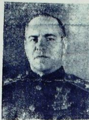
Маршал Советского Союза Г. К. ЖУКОВ

В центральных газетах опубликован Указ Президиума Верховного Совета СССР об учреждении медали „За доблестный труд в Великой Отечественной войне 1941—1945 г. г.“ Медаль учреждается в ознаменование одержанной победы над Германией. Этой высокой награды будут удостоены рабочие, инженерно-технический персонал и служащие промышленности и транспорта, колхозники и специалисты сельского хозяйства, работники науки, техники, искусства и литературы, работники советских, партийных, профсоюзных и других общественных организаций—труженики тыла, обеспечившие своим доблестным и самоотверженным трудом победу над врагом.