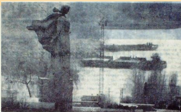
Их помнит мир спасенный...