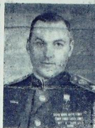
Маршал Советского Союза К. К. РОКОССОВСКИЙ