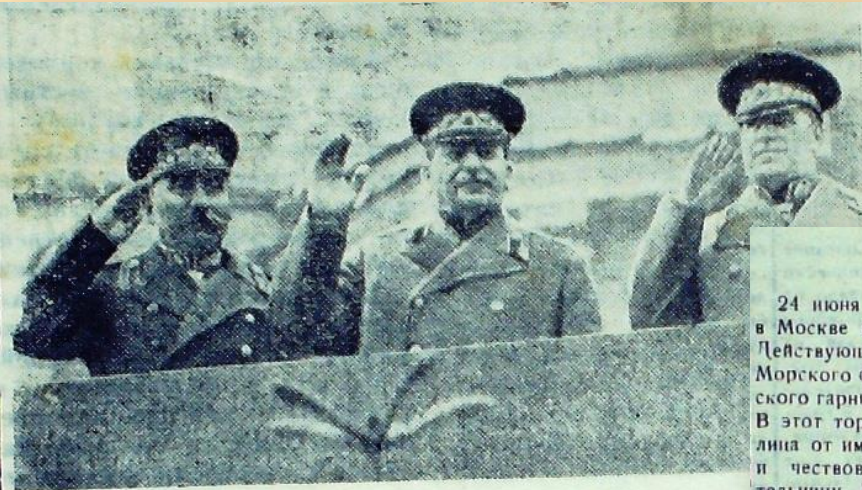
Парад Победы на Красной площади в Москве 1945 года. На трибуне Мавзолея Ленина товарищ И. В. Сталин, Маршал Советского Союза Г. К. Жуков и Маршал Советского Союза С. М. Буденный.