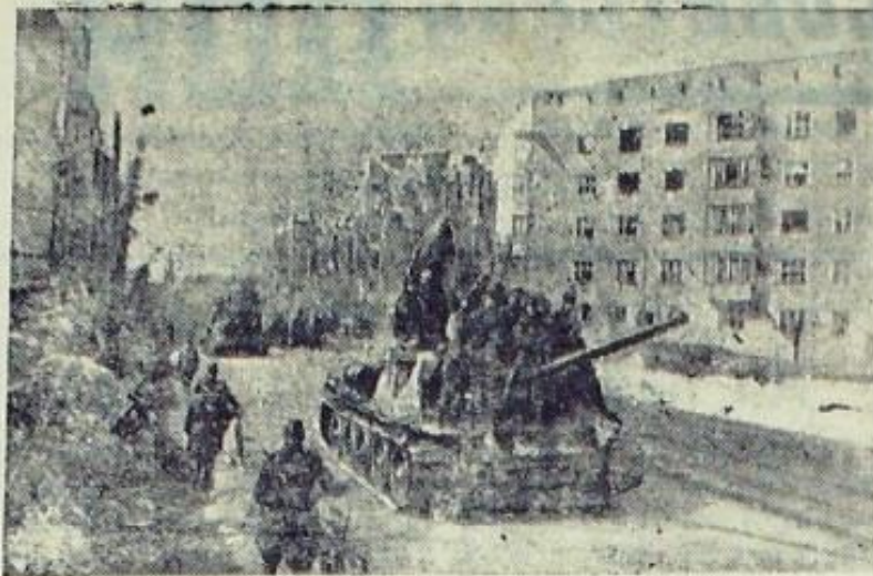
Советские бронетанковые войска проходят по центральным улицам побежденной немецкой столицы.